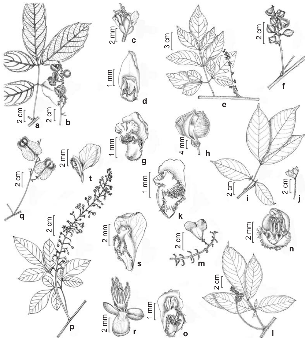
Figura 3 – a-d. Paullinia ferruginea – a. ramo vegetativo; b. ramo com cápsulas maduras; c. flor estaminada; d. face adaxial da pétala posterior, evidenciando apêndice petalífero. e-h. Paullinia micrantha – e. ramo com flores; f. ramo com frutos; g. face adaxial da pétala posterior, evidenciando apêndice petalífero; h. cápsula madura expondo parcialmente uma semente arilada. i-k. Paullinia racemosa – i. ramo vegetativo; j. ramo com frutos imaturos; k. face adaxial da pétala posterior, evidenciando apêndice petalífero. l-o. Paullinia revoluta – l. ramo com flores; m. ramo com cápsula madura; n. flor pistilada desprovida da sépala posterior e da corola, evidenciando os lobos nectaríferos; o. face adaxial da pétala posterior, evidenciando apêndice petalífero. p-t. Serjania salzmanniana – p. ramo com flores; q. ramo com frutos; r. flor estaminada desprovida da corola, evidenciando lobos nectaríferos; s. face adaxial da pétala posterior, evidenciando apêndice petalífero; t. face adaxial da pétala anterior evidenciando apêndice petalífero. (a-d Paixão 51; e, g Sylvestre 997; f, h Fernandes 779; i-j Perdiz 421; k Santos 288; l, n-o Perdiz 564; m Perdiz 487; p, r-t Carvalho 7006; q Cardoso 1636). Figure 3 – a-d. Paullinia ferruginea – a. sterile branch; b. branch with mature capsules; c. staminate flowers; d. adaxial view of posterior petal showing adnate appendage. e-h. Paullinia micrantha – e. branch with flowers; f. branch with fruits; g. adaxial view of posterior petal, showing adnate appendage; h. mature capsule, partially exposing an arillate seed. i-k. Paullinia racemosa – i. sterile branch; j. branch with fruits showing immature capsules; k. adaxial view of posterior petal showing adnate appendage. l-o. Paullinia revoluta – l. branch with flowers; m. branch with mature capsule; n. pistillate flower devoid of posterior sepal and corolla, showing nectary lobes; o. adaxial view of posterior petal, showing adnate appendage. p-t. Serjania salzmanniana – p. branch with flowers; q. branch with fruits; r. staminate flower devoid of corolla, showing nectary lobes; s. adaxial view of posterior petal showing adnate appendage; t. adaxial view of anterior petal, showing adnate appendage. (a-d Paixão 51; e, g Sylvestre 997; f, h Fernandes 779; i-j Perdiz 421; k Santos 288; l, n-o Perdiz 564; m Perdiz 487; p, r-t Carvalho 7006; q Cardoso 1636).