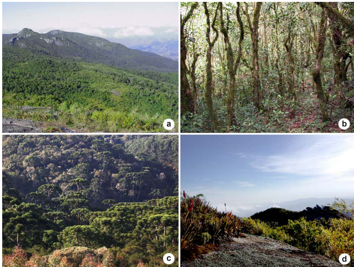
Figura 2 – Fisionomia das formações vegetacionais ocorrentes no distrito de Monte Verde, Camanducaia, Minas Gerais. a. vista panorâmica da Floresta Altimontana; b. vista panorâmica do interior da Floresta Altimontana; c. vista panorâmica da Floresta de Araucária; d. vista panorâmica dos Afloramentos Rochosos.

Figure 2 – Physiognomies of vegetational types in the Monte Verde district, Camanducaia, State of Minas Gerais. a. panoramic view of Upper Montane Forest; b. panoramic view inside of Upper Montane Forest; c. panoramic view of Araucária Forest; d. panoramic view of Rocky Outcrops.