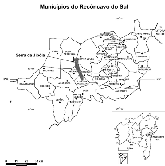
Figura 1 – Mapa com a localização da Serra da Jibóia (em destaque) e indicação do Morro da Pioneira (□).

A Serra da Jibóia é considerada uma das 182 áreas prioritárias para conservação da biodiversidade da Mata Atlântica brasileira, sendo uma das 99 áreas de extrema importância biológica, segundo a Conservação Internacional do Brasil et al. (2000).